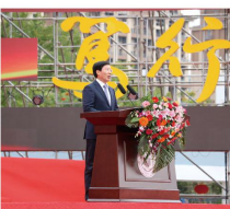
省人大常委会副主任、中共漳州市委书记郑云坤讲话