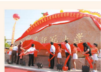
2013年，在闽南师范大学校庆上，是一个庄严的年份。这一年，在母校建校五十五周年，获校史名为闽南师范大学，进入第一批次招生，获得博士学位授予权，为文门首，为校旗领学为校门揭牌。

“昔我往矣，杨柳依依”。距离离别母校，至今已两载春秋。六年前，我满怀对大学的憧憬与憧憬，踏入了