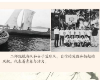
二院建院二十周年纪念。自信的乐观和奋起的风帆，代表着青春与努力。