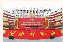
2018年，闽南师范大学60周年校庆，四叶一甲子，再启新征程。