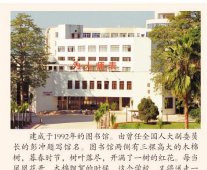
2003年，漳州师范学院获博士学位授予权。