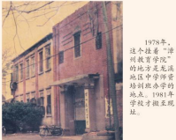
1978年，这个被誉为“漳州教育”的地方是清流地区中等专业学校到建校的地点。1981年学校开始正式招生。