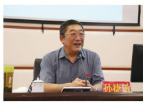
孙捷敏，1981年毕业中文系，福建省广电总台台长，福建省教育电视台台长。