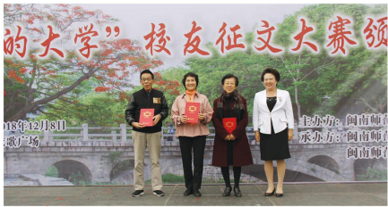
一笔一墨书年华，一朝一夕谱辉煌——我校举办“我的大学”校友征文大赛

年华似水，岁月如梭。母校是校友学习与生活过的地方，校园的每栋建筑、每个角落，每条过道都承载着青春的回忆。